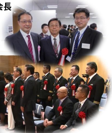
安倍総理より表彰を受ける