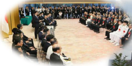
(官邸会場)安倍首相挨拶